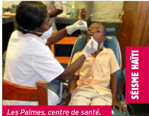
Les Palmes, centre de santé.