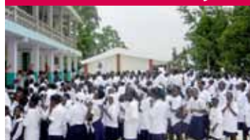
L'école de Carrefour inaugurée.