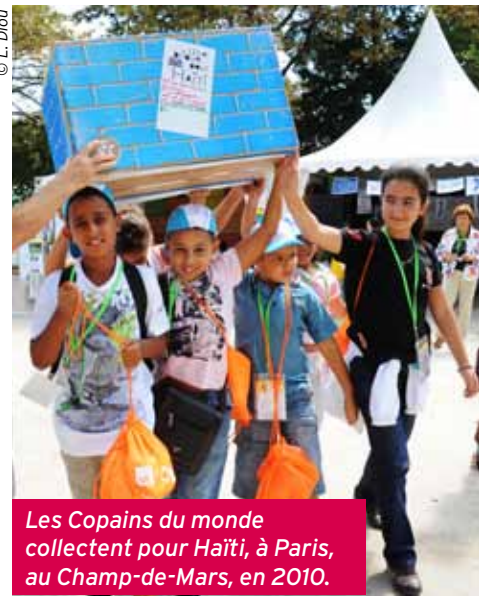
Les Copains du monde collectent pour Haïti, à Paris, au Champ-de-Mars, en 2010.

Supplément à Convergence n° 321 - 9-11 rue Froissart 75140 Paris Cedex 03 - Tél.: 01 44 78 21 00 - Commission paritaire n° 0214H84415. Issn 0293 3292. Impression: Presses de Bretagne - Photogravure: Panchro - Maquette: Hélène Laforêt-Thibault / JBA. Ce numéro a été tiré à 267 000 exemplaires. Dépôt légal: janvier 2012. Directeur de la publication: Robert Olivier. Ont participé à ce numéro: Stéphanie Prouvost, Camille Guérin, Marine Samson, Corinne Makowski, Audrey Champsiaux, Jean-Pierre Delétréz, Régine Riva (révision), Olivier Vilain. Merci à toutes les personnes du Secours populaire qui nous ont aidés à préparer ce numéro.