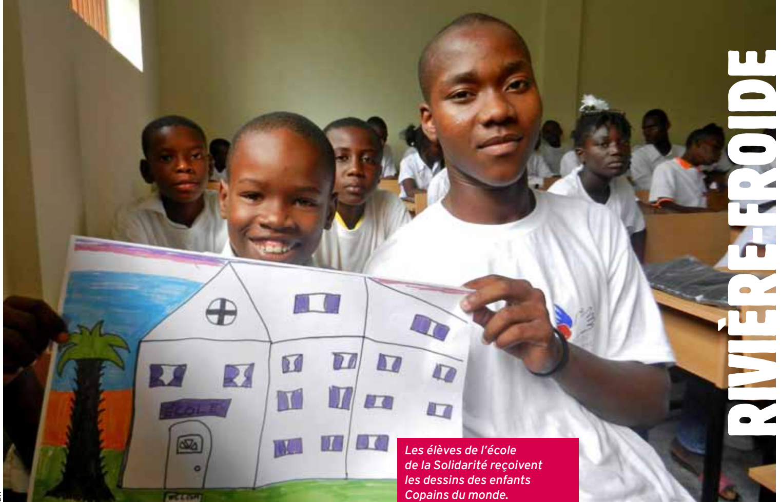
Les élèves de l'école de la Solidarité reçoivent les dessins des enfants Copains du monde.