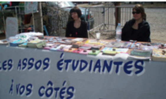
À Marseille, les étudiants se mobilisent dans des collectifs aux côtés du SPF.