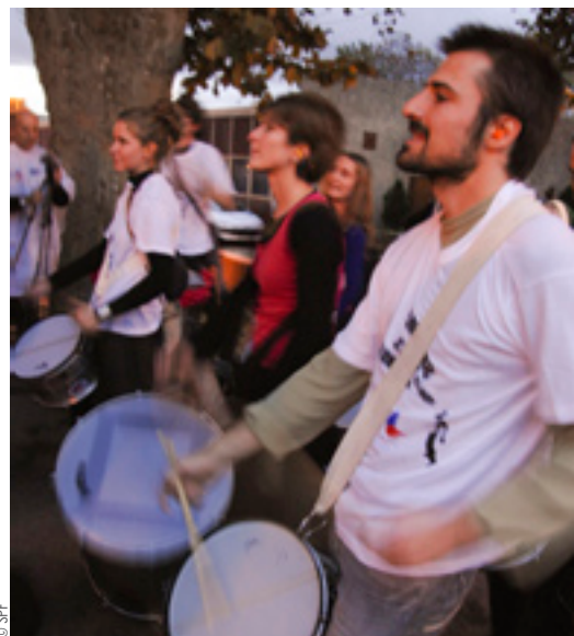
À Aubagne, les jeunes du SPF ont fait une parade de rue.

Les jeunes, qui ont une bonne image des associations, les considèrent comme des structures aptes à porter les valeurs de la citoyenneté. Lorsqu'on leur demande leur motivation, les 18-25 ans répondent massivement «être utile à la société et agir pour les autres». L'approche