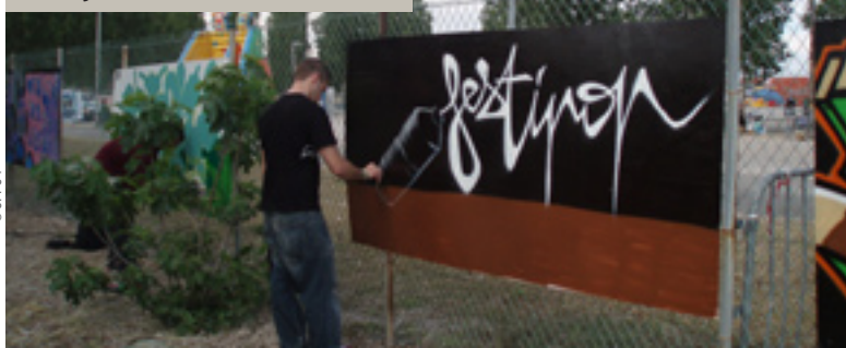
L'édition 2008 du Festipop a rapporté 4 000 euros pour le Niger.

【 Pour en savoir plus : fédération du Vaucluse 04 90 82 27 56 】